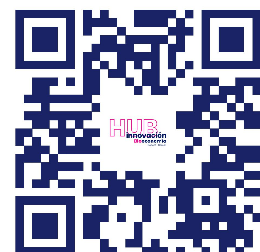
Presentación del evento